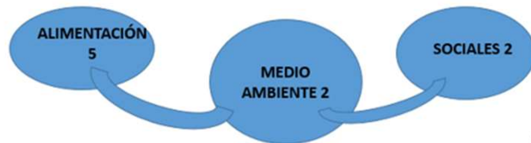
GRÁFICO DE LOS PROYECTOS POR ESPECIALIDADES